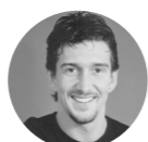
JULIO BOCCA MONTEVIDEO | UY

Ex-bailarino solista da Erich-Weinart Ensemble de Berlin. Mestre professor da Staatliche Ballettschule Berlin.