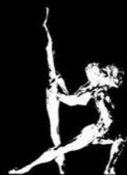
Conselho Brasileiro da Dança

Desde então vem implantando novas diretrizes ao CBDD, estimulando através de seus delegados a realização de Festivais, Simpósios, Cursos e demais atividades de dança em todo país, com a chancela CBDD. Também nesta gestão foram criados os títulos de Conselheiro e Colaborador, para que cada delegado possa ampliar o seu leque de atuação, levando ao interior de cada estado as atuações do CBDD.