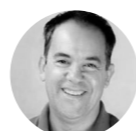
TINDARO SILVANO BELO HORIZONTE | BR

Bailarino argentino, antigo primeiro bailarino do American Ballet Theater. Atualmente diretor artístico do Ballet Nacional Sodre, em Montevideo.